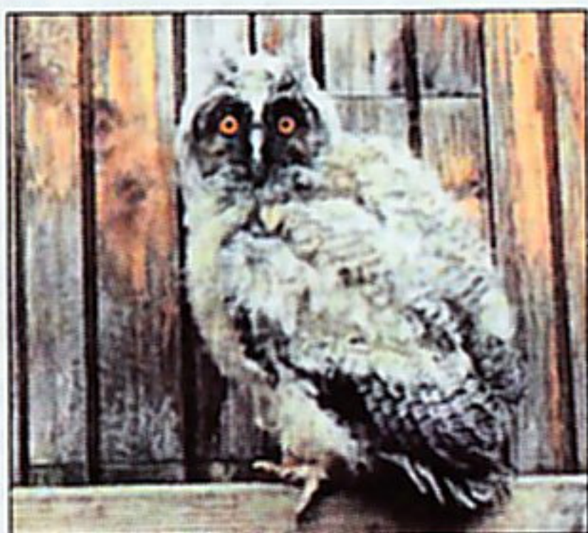
Un hibou moyen-duc.

À l'occasion de ses 50 ans, CL ouvre ses colonnes toute l'année à Charente Nature. Retrouvez ici chaque semaine une chronique réalisée par l'association environnementaliste.