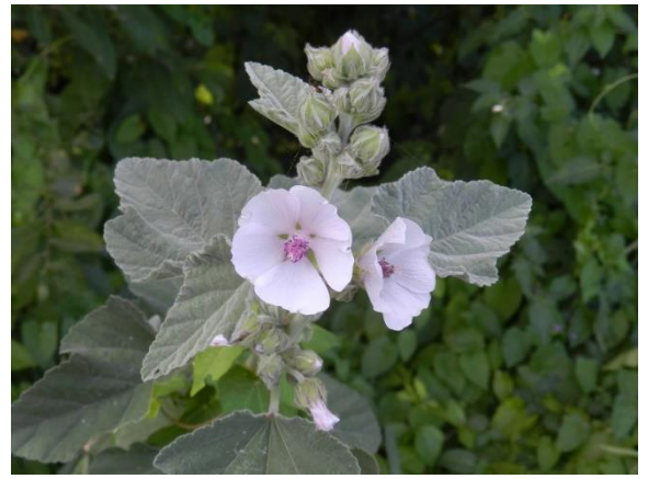
Guimauve officinale – bord de la Péruse