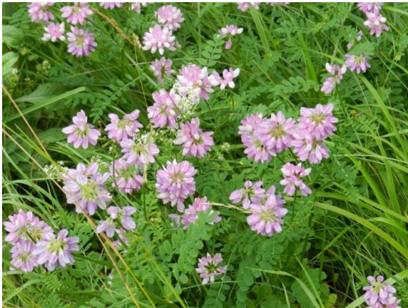
Coronille variée