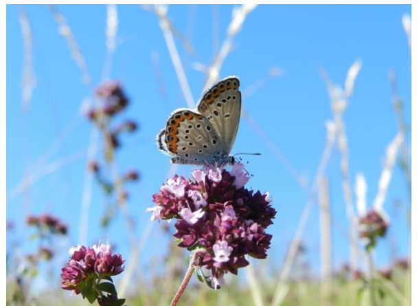
Azuré des coronilles