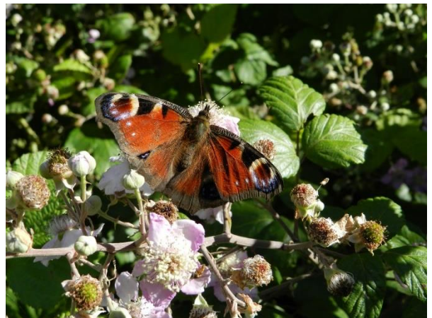
Paon du jour