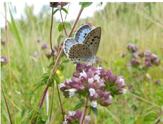
Azuré du serpolet