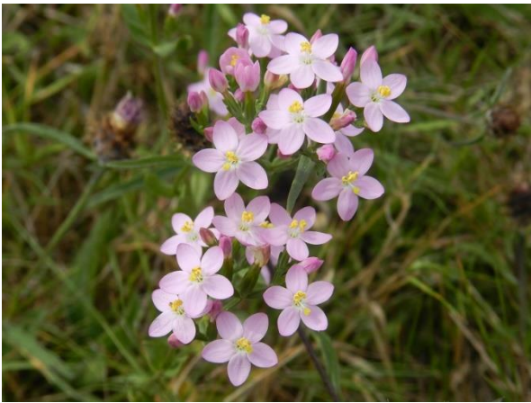
Petite centaurée