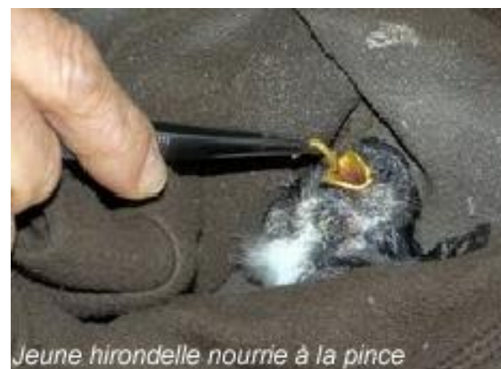
Jeune hirondelle nourrie à la pince

A travers ces différents accueils, nous dégagons toujours des enseignements sur la conduite à tenir en présence d'un animal blessé pour augmenter ses chances de survie : être attentifs, surtout en période