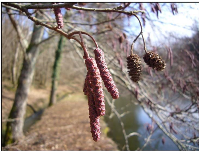
Aulne glutineux