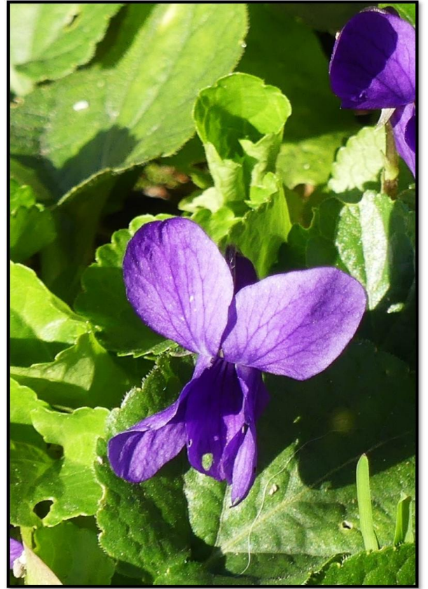
Violette odorante©Albert BRUN