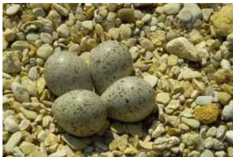
Nid de Petit Gravelot ( Charadrius dubius )