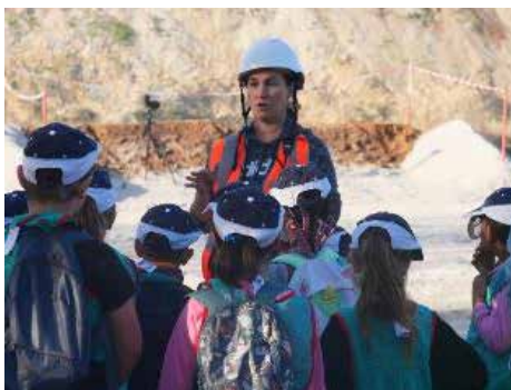
Animation « Biodiversité en carrière » lors de la Journée Portes Ouvertes sur le site de La Rochette