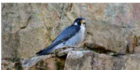
Mâle Faucon pèlerin ( Falco peregrinus )

Financé par les fonds européens (FEDER) et la Région Nouvelle-Aquitaine, ce programme permet d'assurer le suivi des espèces patrimoniales locales, d'accompagner les adhérents et les particuliers sur de nouvelles découvertes botaniques ou encore de protéger les dernières populations encore existantes.