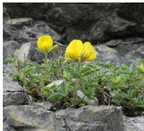
Argyrolobium zanonii