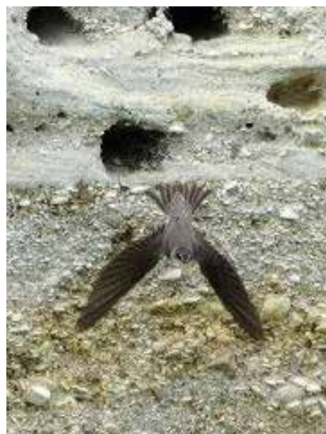
Hirondelle de rivage ( Riparia riparia ) sortant de son nid