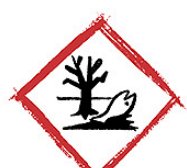
Danger pour l'environnement