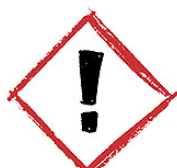
Nocif ou irritant