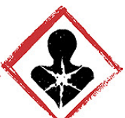
Danger pour la santé