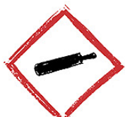
Gaz sous pression